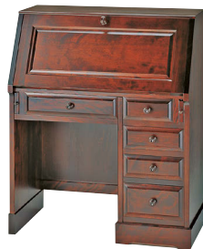
HM600 / HM