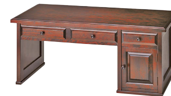
HM420 / HM