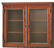
HM008 / HM