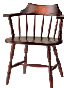
HM630 / HM