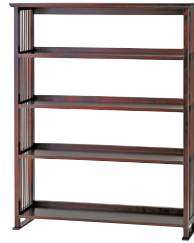
HM116 / HM