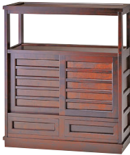
HM105 / HM