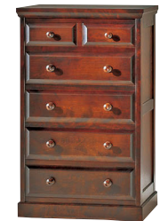
HM534 / HM