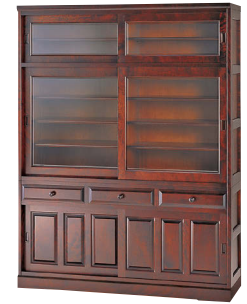
HM166K / HM