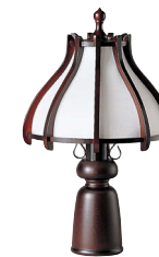
HM888C / HM