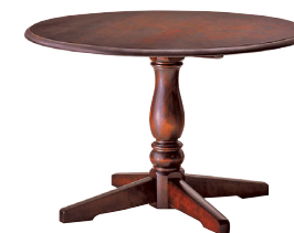
HM4722 / HM