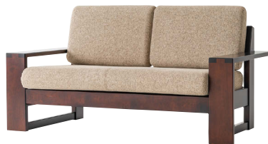
HM103W / HM

※本革仕様の場合、背クッションの中央と座クッションの4等分の位置にステッチが入ります。