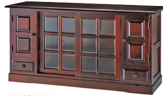
HM135K / HM