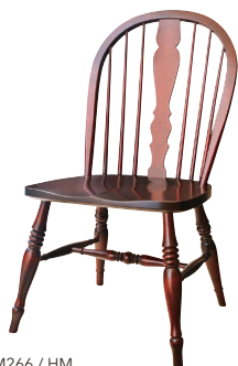
HM266 / HM