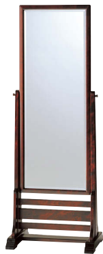
HM350 / HM