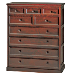
HM533 / HM