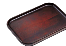
HM927 / HM

※ラッカー塗装は承れません。 ※HM色をお選びいただいた場合、 特別にポリウレタン樹脂塗装となります。