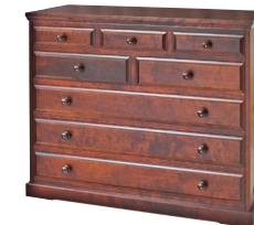
HM531 / HM