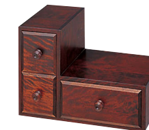
HM909 / HM