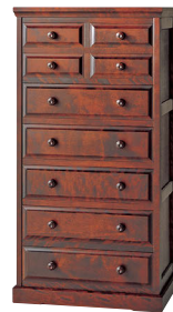
HM535 / HM