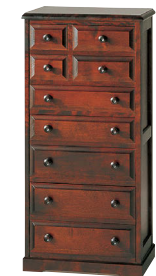
HM875 / HM