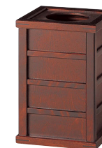
HM898 / HM