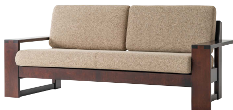
HM103SO / HM

※本革仕様の場合、背クッションの中央と座クッションの4等分の位置にステッチが入ります。