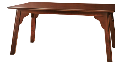
HM334WP / HM