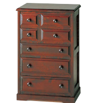
HM874 / HM