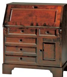
HM800 / HM