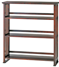
HM117 / HM