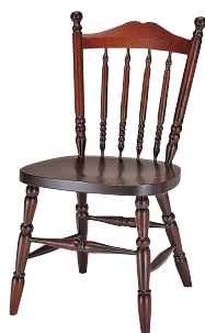
HM626 / HM