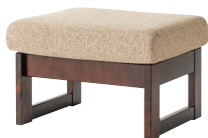
HM103S / HM