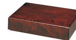
HM910 / HM