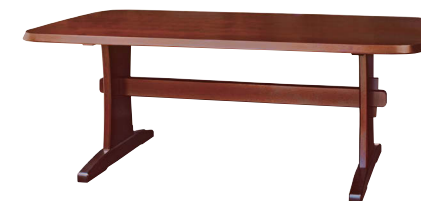
HM325WP / HM