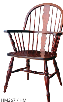
HM267 / HM