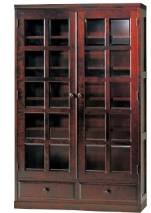
HM115K / HM