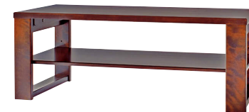
HM103T / HM