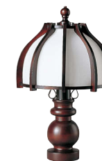
HM888D / HM