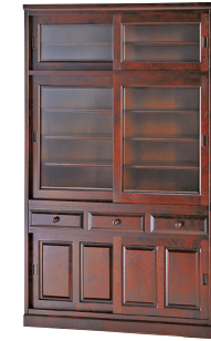
HM161K / HM