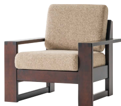
HM103A / HM