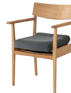
AL263AH / OF

360°あらゆる方向に座面が動くことで腰痛予防、姿勢矯正、バランス能力の改善などの効果が期待できます。