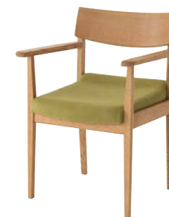
AL262AH / OF