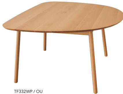
TF332WP / OU