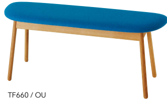
TF660 / OU

※脚部外寸88cmです。 ※本革仕様の場合、クッションの中央にステッチが入ります。