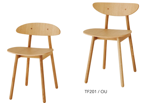
TF221 / OU