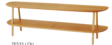
TF533 / OU