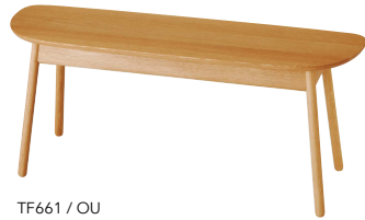
TF661 / OU