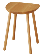
TF601 / OU