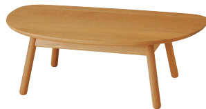
TF102T / OU