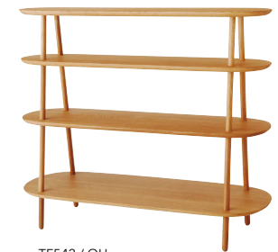
TF542 / OU