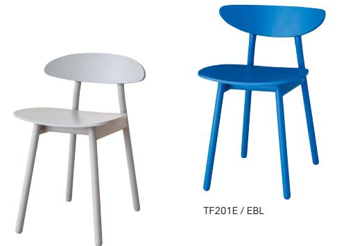
TF221E / EGR