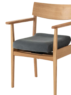
AL263AH / OF

360°あらゆる方向に座面が動くことで腰痛予防、姿勢矯正、バランス能力の改善などの効果が期待できます。