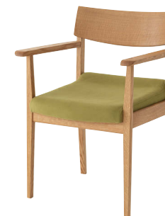
AL262AH / OF

座面はわずかに前傾し、座面後部は骨盤の後方回転を抑制する形状になっています。前かがみ動作の多い方の腰椎や椎間板への負担を軽減することが期待できます。