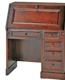
HM600 / HMU