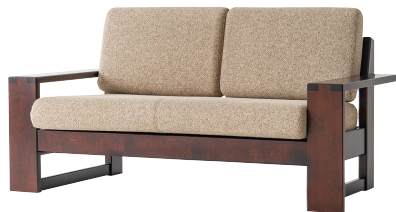
HM103W / HMU

※本革の場合、背クッションの中央と座クッションの4等分の位置にステッチが入ります。