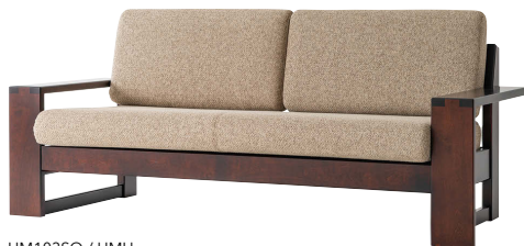
HM103SO / HMU

※本革の場合、背クッションの中央と座クッションの4等分の位置にステッチが入ります。