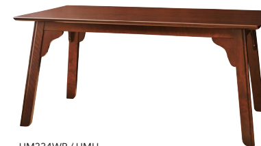
HM325WP / H MU