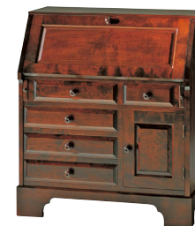
HM800 / HMU