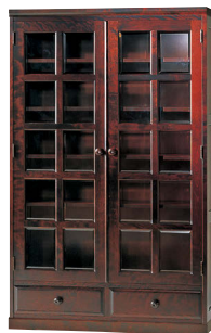
HM115K / HMU