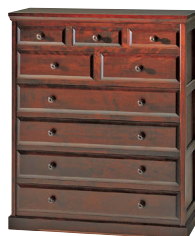
HM533 / HMU