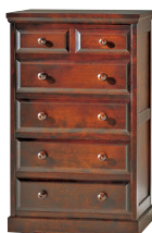
HM534 / HMU