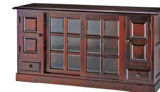
HM135K / HMU