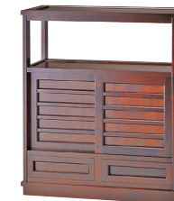
HM105 / HMU