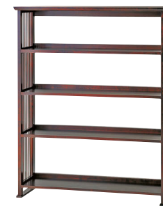
HM116 / HMU