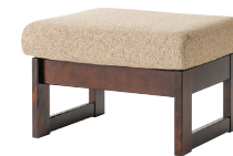
HM103S / HMU