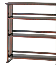
HM117 / HMU