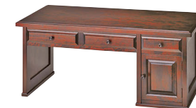
HM420 / HMU