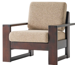
HM103A / HMU