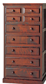
HM535 / HMU