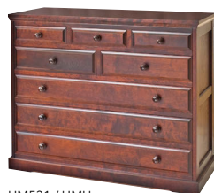
HM531 / HMU