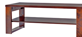
HM103T / HMU