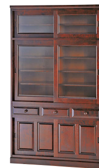
HM161K / H MU