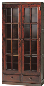
HM114K / HMU