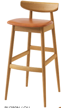
PU280N / OU