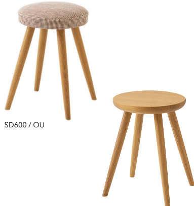
SD600 / OU