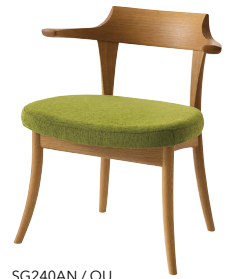
SG240AN / OU