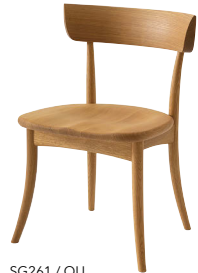
SG261 / OU