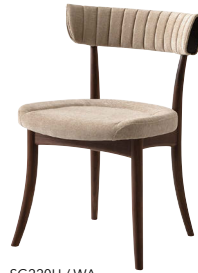
SG220U / WA