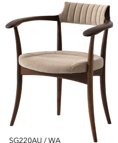
SG220AU / WA