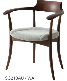
SG210AU / WA