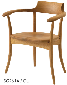
SG261A / OU