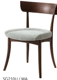
SG210U / WA