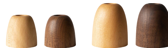
それぞれ左から順に、ビーチ・ウォルナット