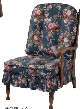
HK255L / K