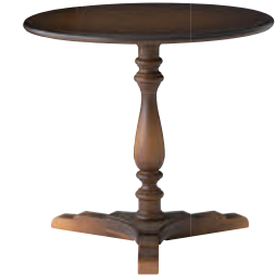
DK319 / K