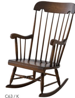
C63 / K