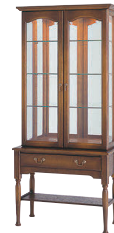
HK570 / K