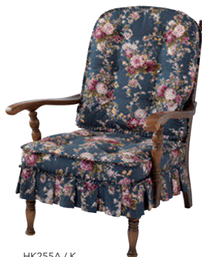
HK255A / K

※オプションにてカバーリング仕様をお選びいただけます。 別途¥8,800 (¥8,000)