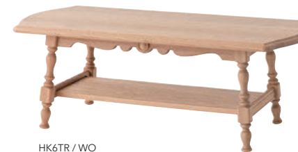
HK6TR / WO