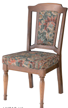
HK212 / K