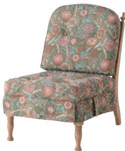
No.6O / WO