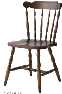
DK268 / K