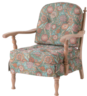
No.6A / WO

※オプションにてカバーリング仕様をお選びいただけます。 別途¥6,600(¥6,000)