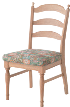
HK201 / WO