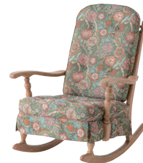
No.6RC / WO

※オプションにてカバーリング仕様をお選びいただけます。 別途¥8,800(¥8,000)