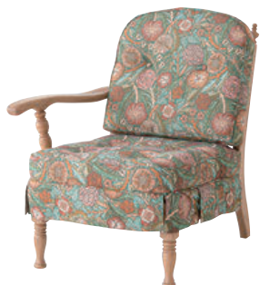
No.6R / WO

※オプションにてカバーリング仕様をお選びいただけます。 別途¥6,600(¥6,000)