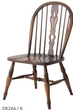
DK266 / K