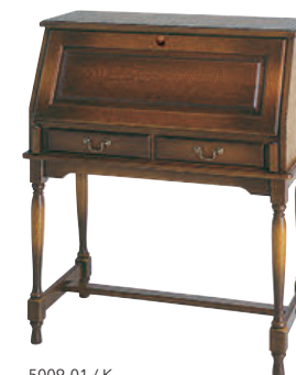
5009-01 / K