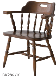
DK286 / K