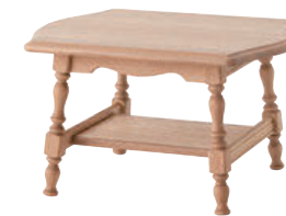
HK6CTR / WO