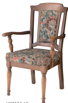
HK212A / K