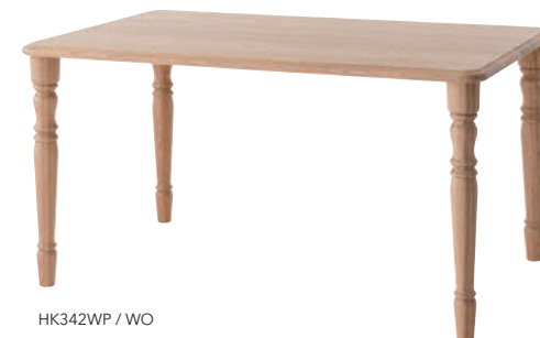
HK342WP / WO