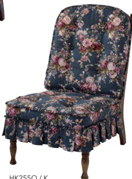
HK255O / K

連結マジックバンド同梱 ※オプションにてカバーリング仕様をお選びいただけます。 別途¥8,800 (¥8,000)