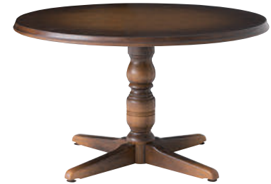
DK341 / K