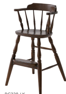
BC238 / K