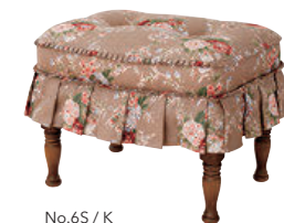
No.6S / K

※オプションにてカバーリング仕様をお選びいただけます。 別途¥3,300(¥3,000)