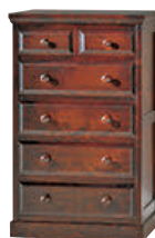
HM534 / HMU