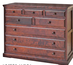
HM531 / HMU