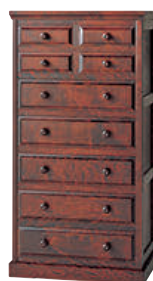
HM535 / HMU