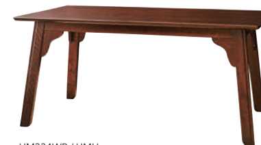
HM334WP / HMU