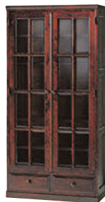
HM114K / HMU