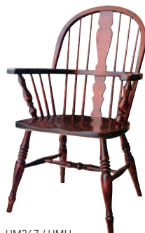
HM267 / HMU