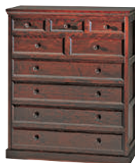
HM533 / HMU