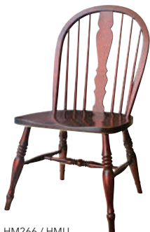
HM266 / HMU