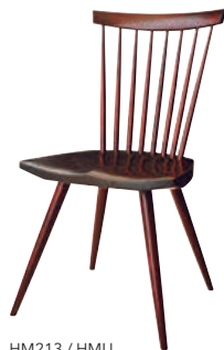
HM213 / HMU