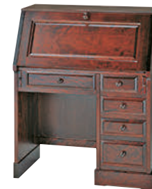
HM600 / HMU