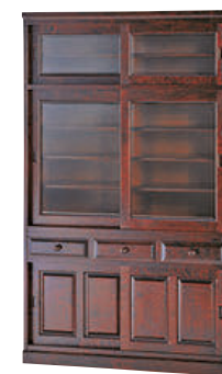
HM161K / HMU