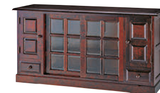
HM135K / HMU