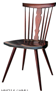
HM214 / HMU