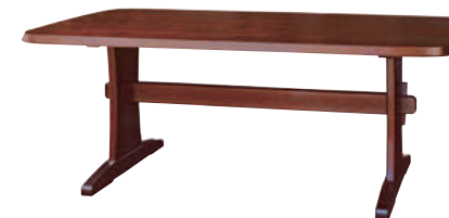
HM325WP / HMU