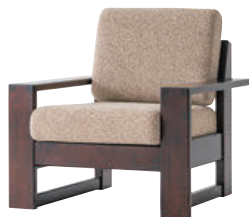
HM103A / HMU