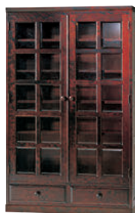
HM115K / HMU