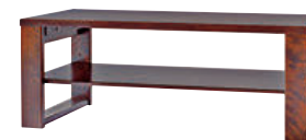
HM103T / HMU