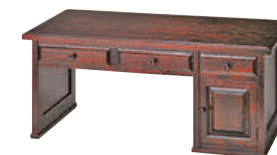
HM420 / HMU