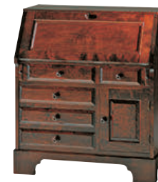
HM800 / HMU