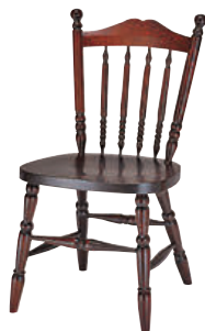
HM626 / HMU