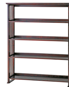
HM116 / HMU