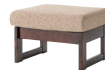
HM103S / HMU