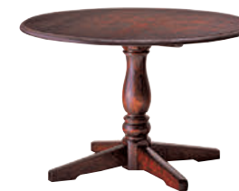
HM4722 / HMU