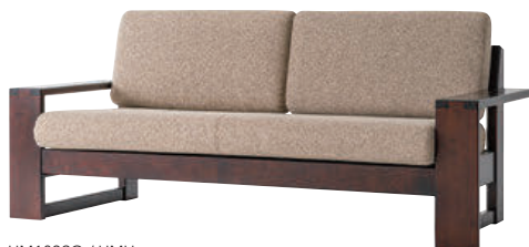
HM103SO / HMU

※本革の場合、背クッションの中央と座クッションの4等分の位置にステッチが入ります。