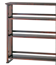
HM117 / HMU