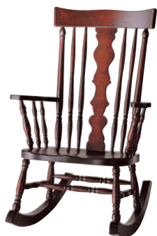
HM663 / HMU