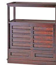
HM105 / HMU