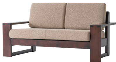
HM103W / HMU

※本革の場合、背クッションの中央と座クッションの4等分の位置にステッチが入ります。