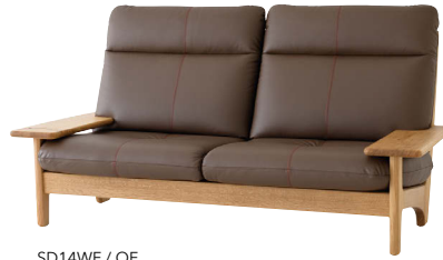
SD14WF / OF