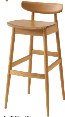
PU281N / OU

※高さ1mのカウンターに対応しています。 ※ご使用のカウンターの高さに合わせて脚カットを承ります(有料)。 下から10cmまでご指定ください。