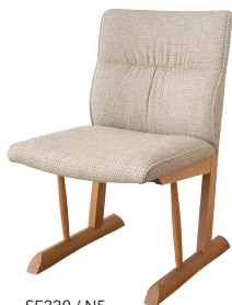
SE220 / N5