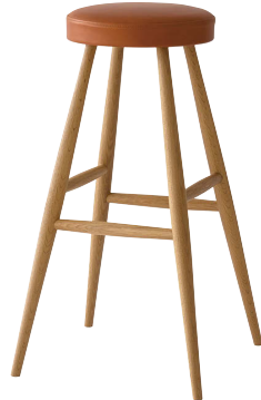
SD280N / OU

※高さ1mのカウンターに対応しています。 ※ご使用のカウンターの高さに合わせて脚カットを承ります(有料)。 下から28.5cmまでご指定ください。 ※踏み台としてはご使用にならないでください。