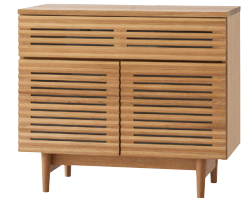
SD552N / OU