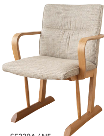
SE220A / N5