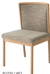
PU250 / WO