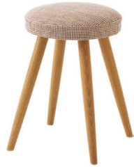
SD600 / OU