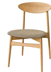
SD220N / OU

SD220N ホワイトオーク ポリウレタン樹脂塗装(*1) B ¥48,400 (¥44,000) C ¥49,500 (¥45,000) E ¥51,700 (¥47,000) 本革B ¥64,900 (¥59,000) 本革D ¥68,200 (¥62,000)