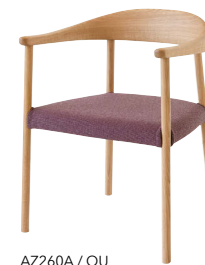
AZ260A / OU

AZ260A ホワイトオーク ポリウレタン樹脂塗装 B ¥83,600 (¥76,000) C ¥84,700 (¥77,000) E ¥86,900 (¥79,000) 本革B ¥100,100 (¥91,000) 本革D ¥103,400 (¥94,000)