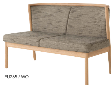
PU265 / WO