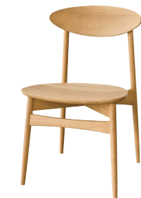
SD221N / OU

SD221N ホワイトオーク ポリウレタン樹脂塗装(*1) ¥60,500 (¥55,000)