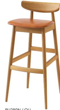
PU280N / OU

※高さ1mのカウンターに対応しています。 ※ご使用のカウンターの高さに合わせて脚カットを承ります(有料)。 下から10cmまでご指定ください。