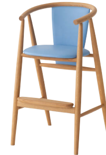
BC237 / OU

*ポリウレタン樹脂塗装のあとに(*1)と記載されている商品は10%アップの価格でオイル仕上げにも対応しています。