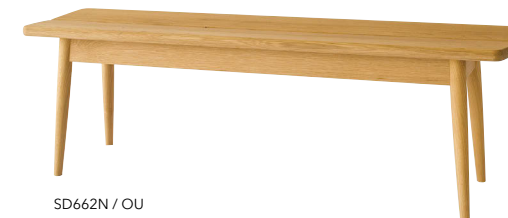
SD662N / OU

※SD664専用の座クッションです。 ※紐でベンチに固定する仕様です。 ※本革の場合、クッションの中央にステッチが入ります。