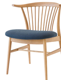
SD270AN / OU

SD270AN ホワイトオーク ポリウレタン樹脂塗装(*1) SD270AB ビーチ ポリウレタン樹脂塗装(*1) SD270AU ウォルナット ポリウレタン樹脂塗装 B ¥88,000 (¥80,000) ¥80,300 (¥73,000) ¥104,500 (¥95,000) C ¥89,100 (¥81,000) ¥81,400 (¥74,000) ¥105,600 (¥96,000) E ¥91,300 (¥83,000) ¥83,600 (¥76,000) ¥107,800 (¥98,000) 本革B ¥104,500 (¥95,000) ¥96,800 (¥88,000) ¥121,000 (¥110,000) 本革D ¥107,800 (¥98,000) ¥100,100 (¥91,000) ¥124,300 (¥113,000)