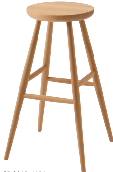
SD281B / NY

※高さ1mのカウンターに対応しています。 ※ご使用のカウンターの高さに合わせて脚カットを承ります(有料)。 下から28.5cmまでご指定ください。 ※踏み台としてはご使用にならないでください。