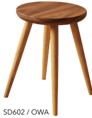
SD602 / OWA

※踏み台としてはご使用にならないでください。 ※ツートンの場合は座板がウォルナットとなります。