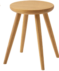
SD601 / OU