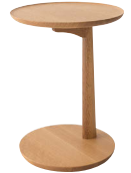
SD605N / OU