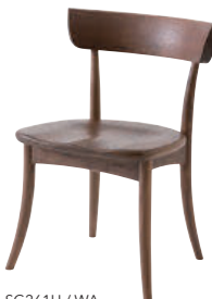
SG261U / WA