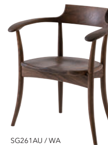
SG261AU / WA