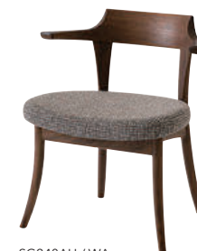
SG240AU / WA