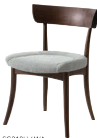
SG210U / WA