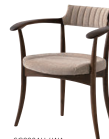
SG220AU / WA