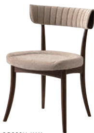
SG220U / WA