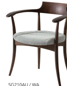
SG210AU / WA