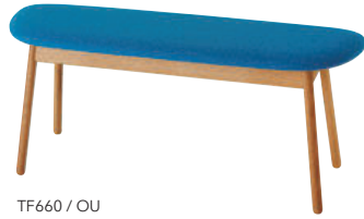
TF660 / OU