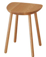
TF601 / OU