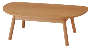
TF102T / OU