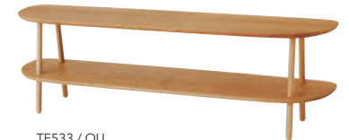
TF533 / OU