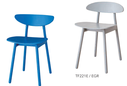
TF201E / EBL