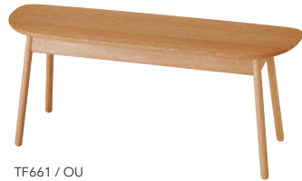
TF661 / OU