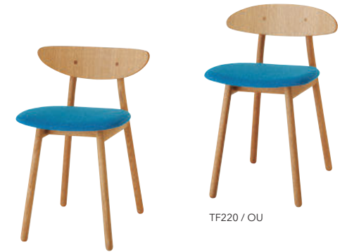
TF200 / OU