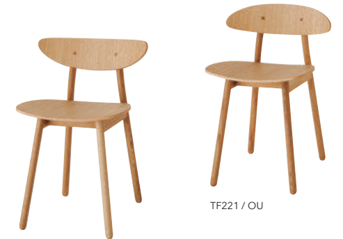
TF201 / OU